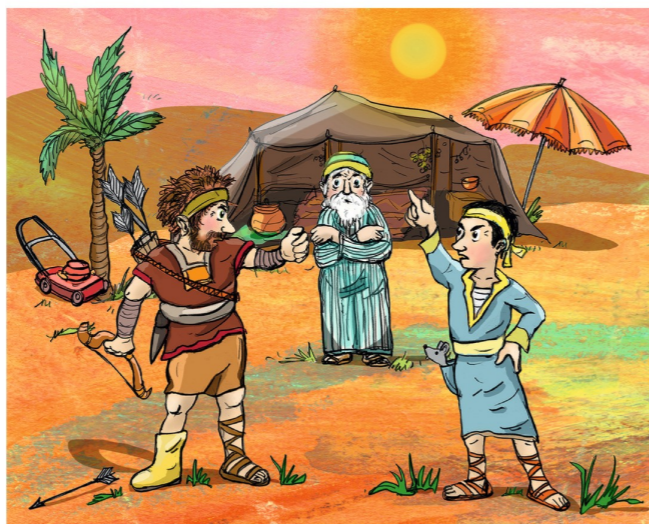
Lösung: Rasenmäher, Sonnenschirm, Gummistiefel, Maus in der Tasche

Sonntag, 27.10.: 11:00 Pfarrheim: Gemeindetreff