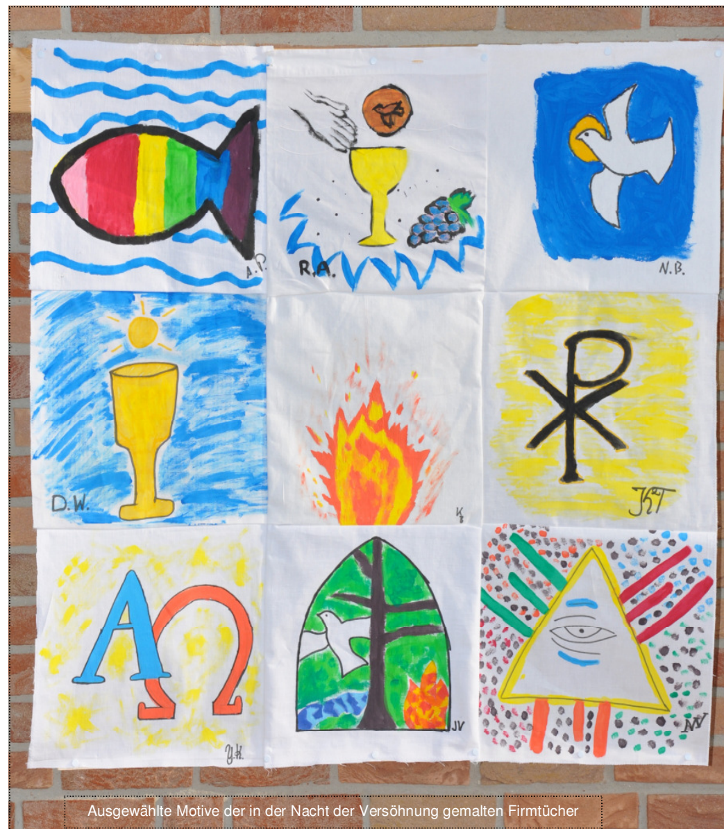
Ausgewählte Motive der in der Nacht der Versöhnung gemalten Firmtücher

Den jugendlichen und erwachsenen Firmbewerbern, die am 22. bzw. am 27. Mai durch Weihbischof Manfred Grothe das Sakrament der HI. Firmung empfangen, wünschen wir einen schönen Tag im Kreise ihrer Familien.