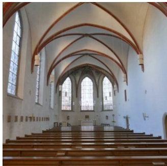
Kirchraum (Blick zum Altar)