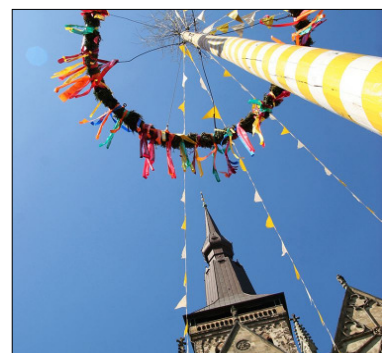
Ein Leben ohne Feste ist wie eine weite Reise ohne Gasthaus. Demokrit