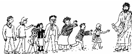
Auf den Spuren des Hl. Paulus