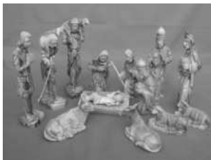
Krippe aus Bethlehem