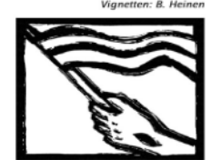
Ostern Den Tod durchbrochen.

Ostersonntag - 5. April 2015 Evangelium: Johannes 20,1-18