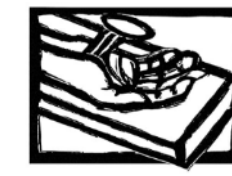
Karfreitag Am Kreuz gebrochen.