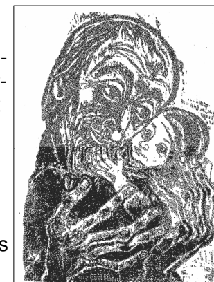
Holzschnitt von Walter Habdank

noch einen Frieden und eine Freude ausstrahlen, die nicht verbittert sind, nicht nur um sich selbst kreisen. Es sind Menschen, die die Fähigkeit bewahrt haben, das Gute in ihrem Leben und in den Menschen zu sehen trotz mancher Enttäuschung und oft harten Schicksalsschlägen. Doch ihnen gelingt es, die Schätze ihres Lebens dankbar zu erinnern, mit Gelassenheit, manchmal sogar Heiterkeit, das zu lassen, was nicht mehr geht und ein waches Interesse an den Plänen und Problemen der nachfolgenden Generation zu bewahren. Solche Menschen sind ein Segen. Sie können auch deshalb sein, weil es jüngere Menschen gibt, die ihnen Wertschätzung entgegenbringen, ihre Lebenserfahrung achten und nicht als unnützes Zeug von gestern abtun, die Geduld mit ihren Einschränkungen aufbringen und sie ihrerseits an ihrem Leben teilnehmen lassen, von ihren Interessen und neuen Entwicklungen erzählen.