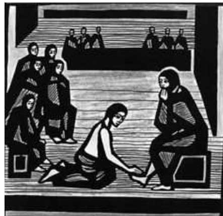
Gründonnerstag: Seine Liebe zulassen