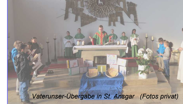
Vaterunser-Übergabe in St. Ansgar

Am 07. und 08. November wurde in unseren Kirchen St. Johannes Baptist, St. Paulus, St. Ansgar sowie im Dom im Rahmen der Heiligen Messe das „Vaterunser“, das Herzensgebet Jesu, feierlich an unsere 79 Erstkommunionkinder überreicht. Nach